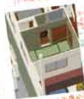
PCは図面を動かすのが大変 見ることが出来ます